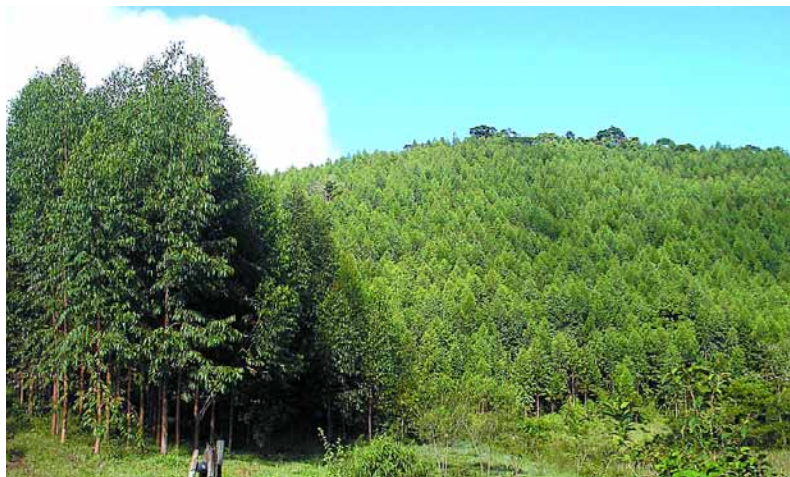
□ Plantação de eucalipto para carvão, em parceria com a Belgo Mineira. As árvores já estão com dois anos de idade.

Nas simulações que fez, a pecuária solteira tradicional (considerando os mesmos dados acima) daria receita de R$ 7.110/ha em 18 anos. Isso prova que a tecnificação da atividade, visando elevar a produção de carne por animal e por hectare, é fundamental para torná-la mais rentável. Quanto ao projeto para carvão, ele prevê o plantio de 1.300 árvores/ha, com custo de implantação de R$ 3.000. Serão feitos três cortes anuais, o que garantirá receita bruta de R$ 16.400 (veja tabela). ◀